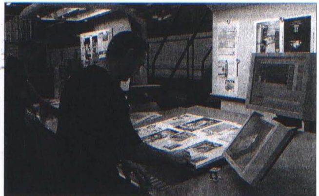
Trois rotativistes suffisent à faire fonctionner cette machine ultra-automatisée.