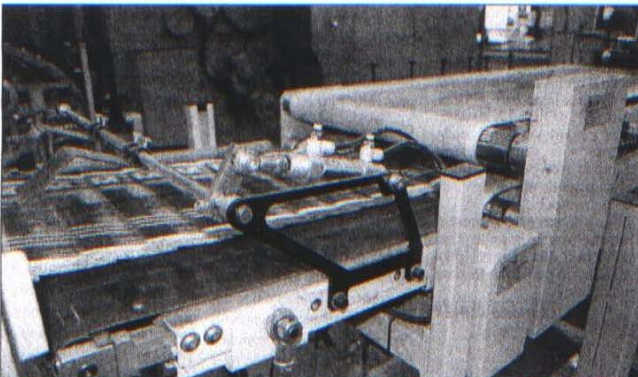
La Komori est capable de sortir des publications de 32 pages (format A4, soit 21 sur 29,7 cm) au rythme de 78 000 exemplaires par heure.