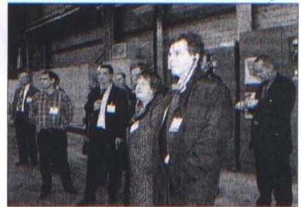
L'imprimerie assurait des visites guidées.